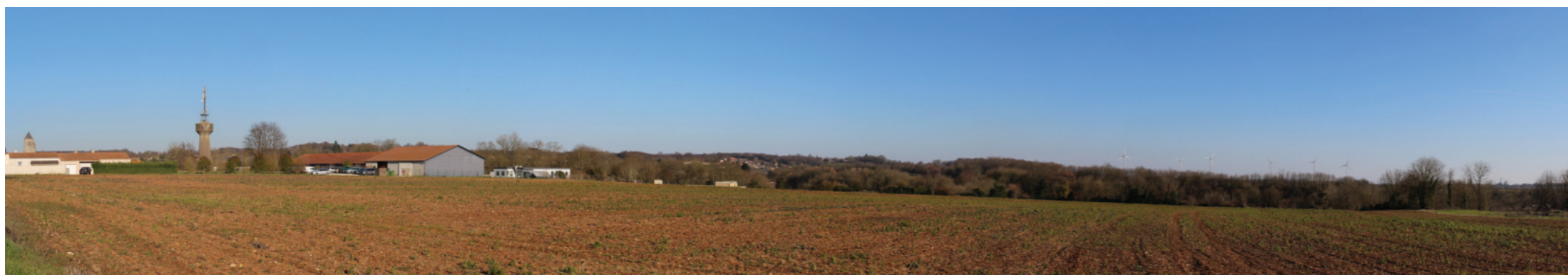
Vue panoramique de l'état initial (angle de vue 120°)