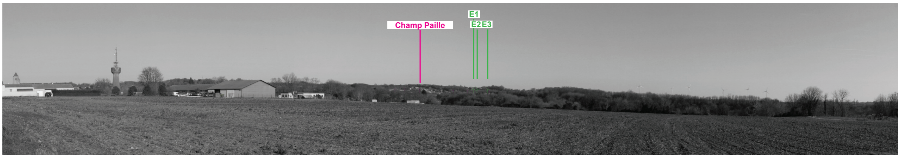
Vue panoramique noir et blanc avec esquisse du projet (angle de vue 120°)